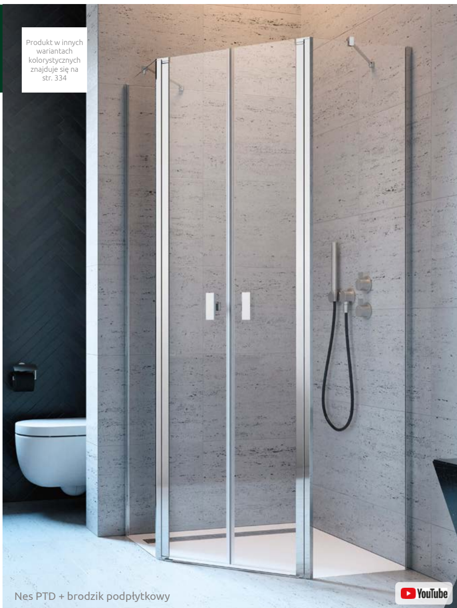
Nes PTD + brodzik podpłytkowy

Składając zamówienie, należy podać 2 numery artykułów: drzwi oraz kompletu ścianek Z i S.