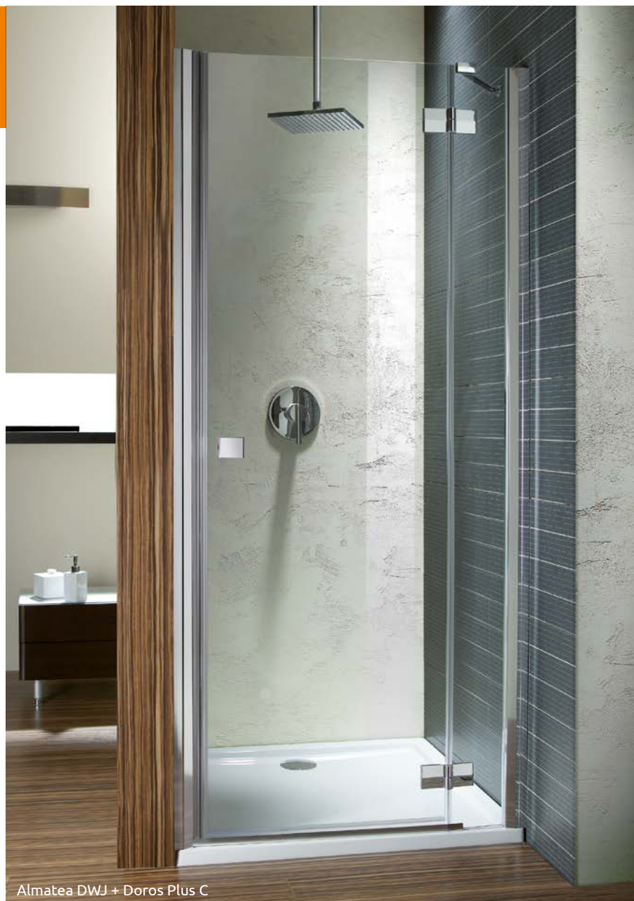
Almatea DWJ + Doros Plus C