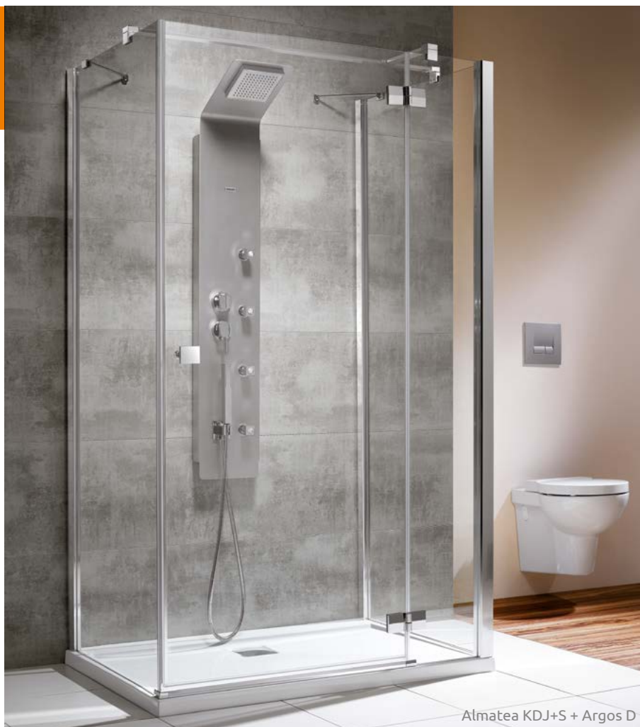
Almatea KDJ+S + Argos D