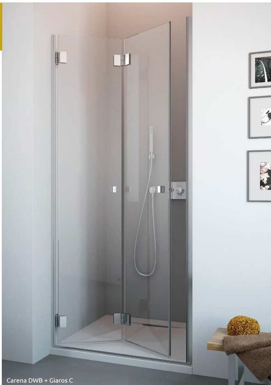
Carena DWB + Giaros C