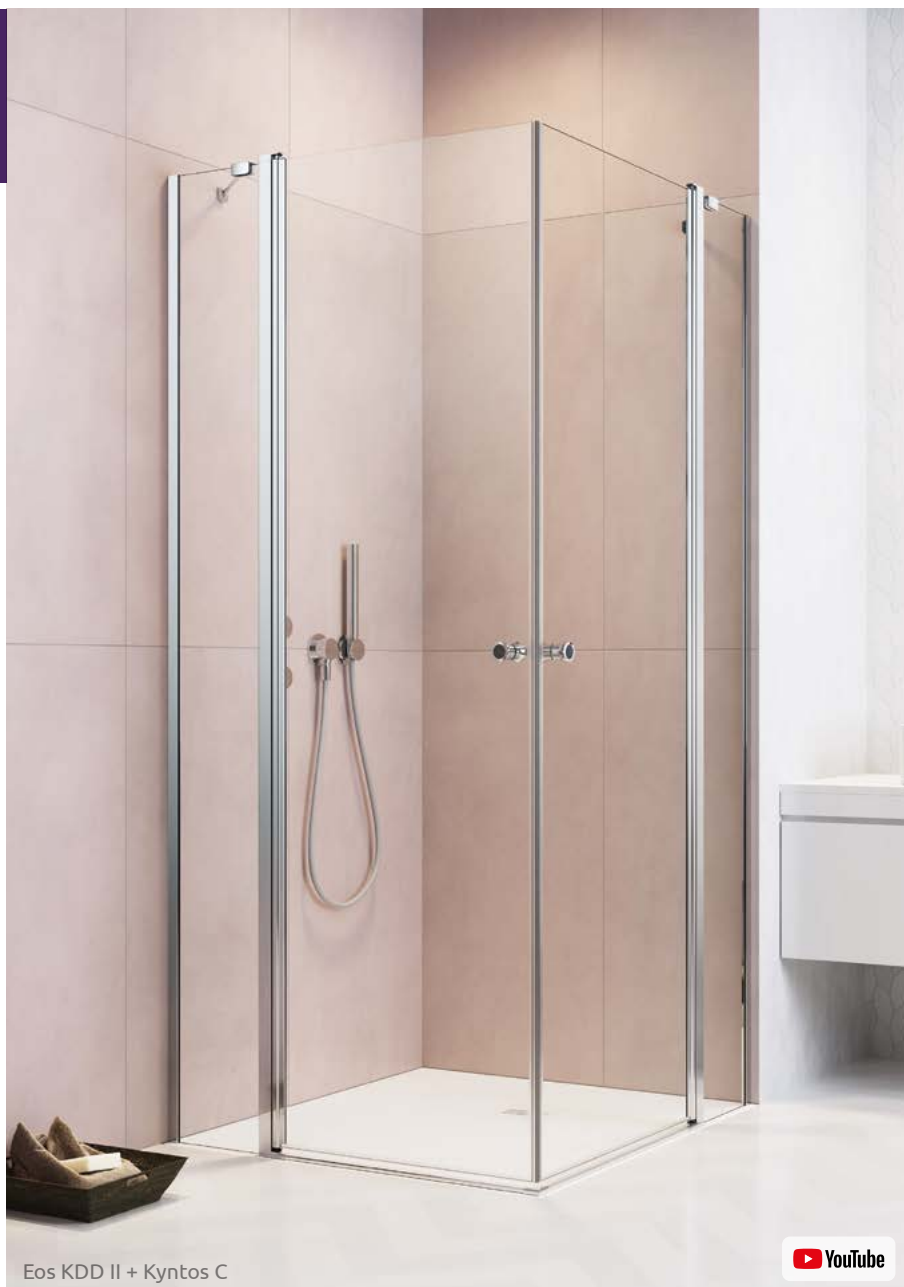
Eos KDD II + Kyntos C