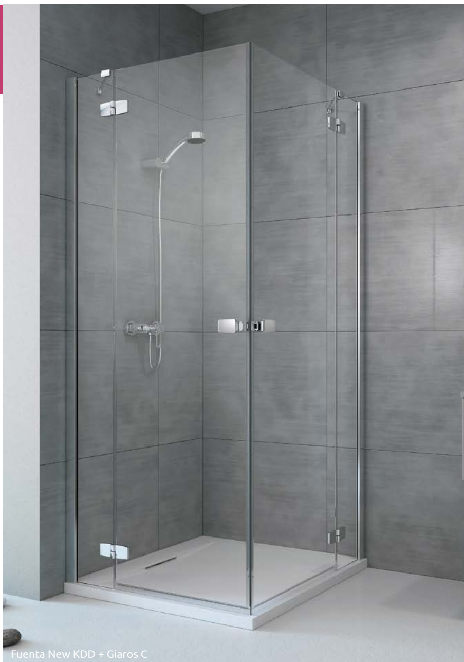
Fuenta New KDD + Giaros C