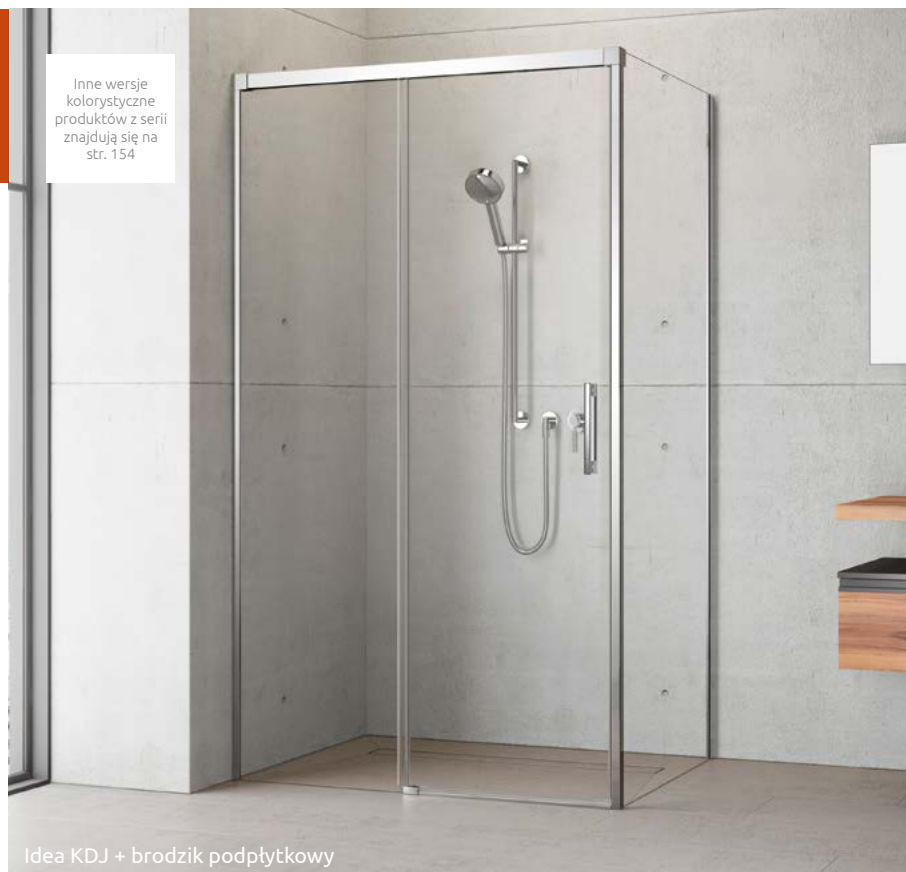
Idea KDJ + brodzik podpłytkowy

Składając zamówienie, należy podać 2 numery artykułów: drzwi oraz ścianki bocznej S1.